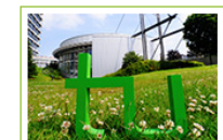
Die Projektbeschreibung für "DoProfil" finden Sie auf der Homepage des Projekts

(Wissenschaftliche Mitarbeiterin am zhb, Professur für Hochschuldidaktik und Hochschulforschung)