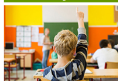
Veranstaltungsformate entwickelt.

Mit dem Auftrag einer chancengerechten Teilhabe an Bildung zentriert DoProfil die zukünftige Lehrer_innenbildung auf den konstruktiven Umgang mit der Vielfalt von Lehr- und Lernvoraussetzungen. Dabei steht ein weit gefasstes Diversitäts- und Inklusionsverständnis im Zentrum, welches allgemeine/fachspezifische kognitive Fähigkeiten, von Lernschwierigkeiten bis Hochbegabung, motorische/sensorische Beeinträchtigung, emotionale/soziale Entwicklung, geistige Entwicklung, kulturellen Hintergrund, sprachliche Kompetenzen, Geschlecht, soziale Herkunft und Religion mit einbezieht. Im Sinne eines strategischen Changemanagements verfolgt das Projekt das Ziel, die Qualität der Lehrer_innenbildung insgesamt zu steigern sowie für die veränderten Anforderungen gerade auch vor dem Hintergrund zunehmender Heterogenität profilierte Modelle zu entwickeln und zu implementieren. Dazu werden an der TU Dortmund neue fachspezifische wie auch fachübergreifende Konzepte und