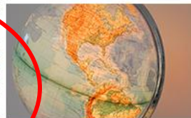
Bereich Behinderung und Studium